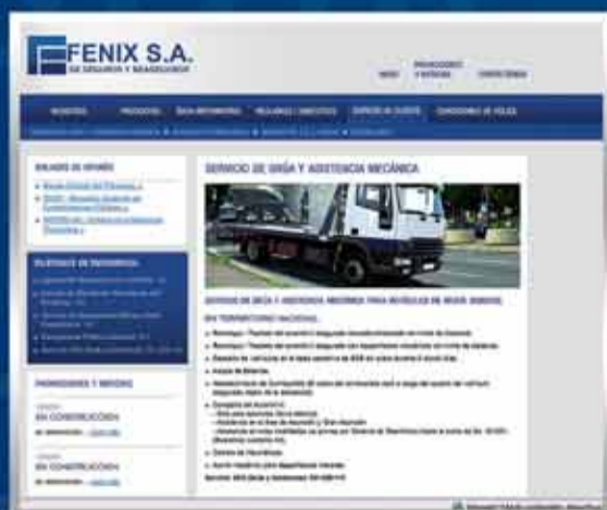
• Servicio al Cliente