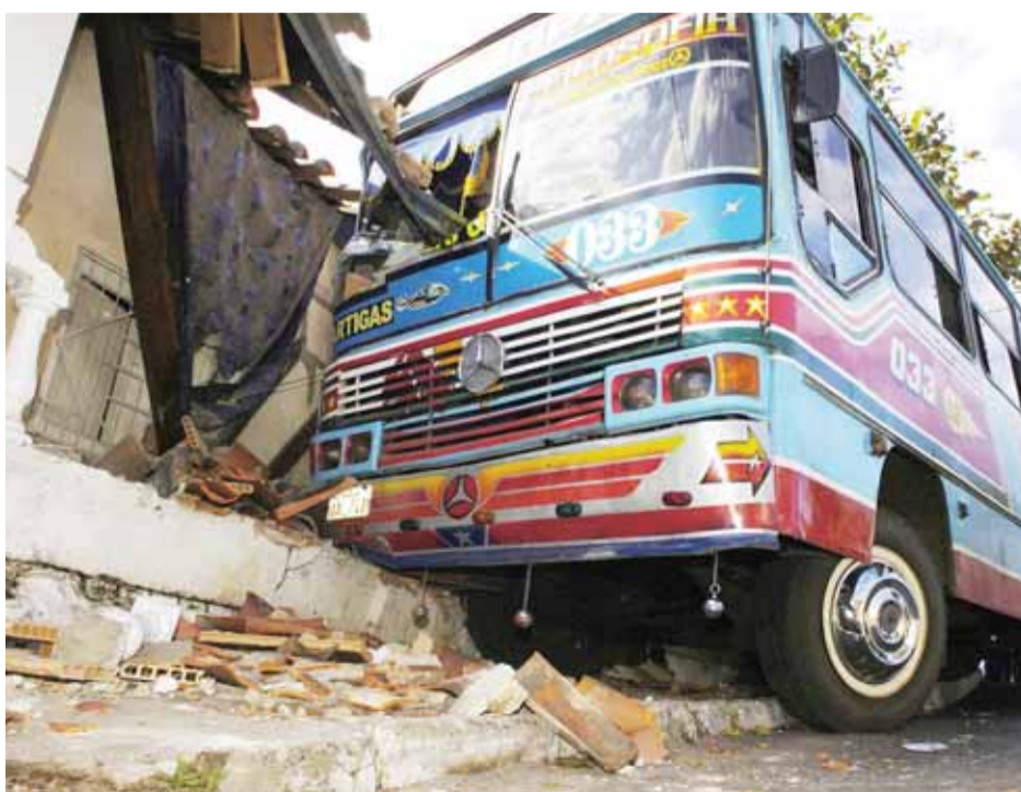
Rumbos SA ofrece pólizas para proteger a pasajeros y el patrimonio de sus clientes.