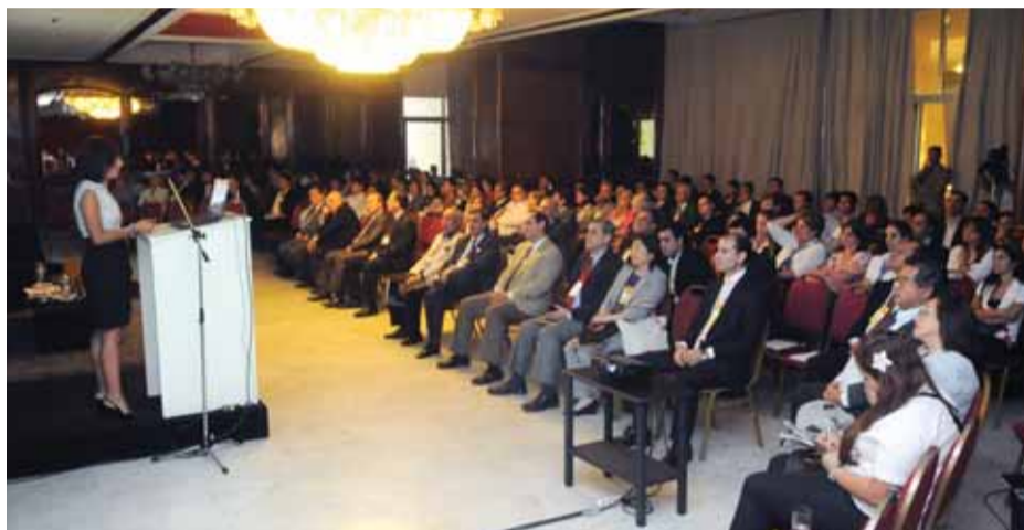
La aseguradora Tajy formó parte del Primer Congreso Paraguayo de Seguros.

Con la finalidad de potenciar aún más el sector de microseguros, la aseguradora Tajy viene impulsando fuertemente la educación financiera entre sus cooperativistas asociados.