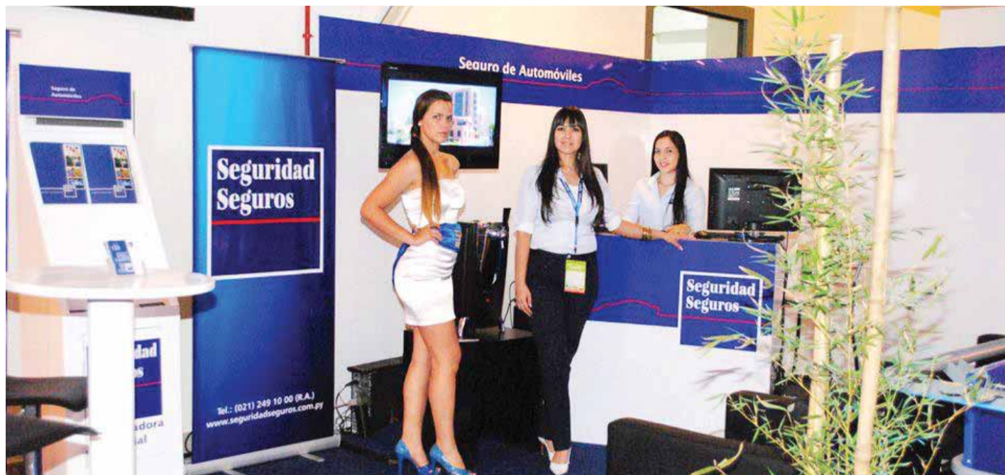
La empresa Seguridad Seguros acompañó la Cadam Motor Show 2012.

Los interesados en adquirir o interiorizarse a cerca de este nuevo servicio pueden comunicarse al Centro de Atención al Cliente al 249 1000 ■