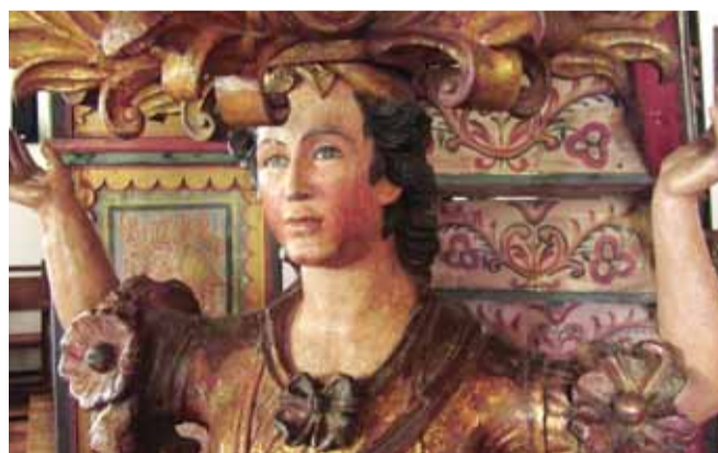
El Sol del Paraguay es pionera y única compañía del sector que contempla la protección de piezas de arte pictórico y sacro.

Los interesados en conocer más detalles sobre este producto pueden enviar un e-mail a la siguiente dirección de correo rlongstaff@elsol.com.py ■