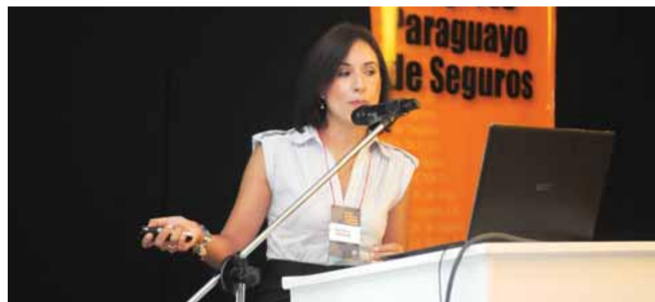
El Primer Congreso Paraguayo de Seguros convocó a especialistas nacionales y extranjeros.

El organizador del congreso adelantó que debido al éxito de la jornada se podría analizar los preparativos