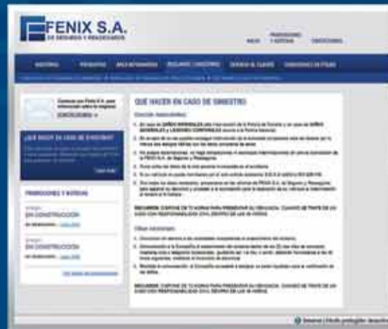
• Denuncia de Siniestros