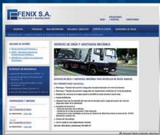
• Servicio al Cliente