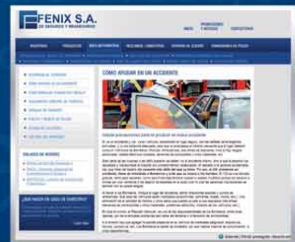
• Seguridad Vial

Casa Central – Asunción Dirección: Iturbe 823 esq. Fulgencio R. Moreno Teléfono: 595 21 494-909 Email: fenixsa@fenixseguros.com.py