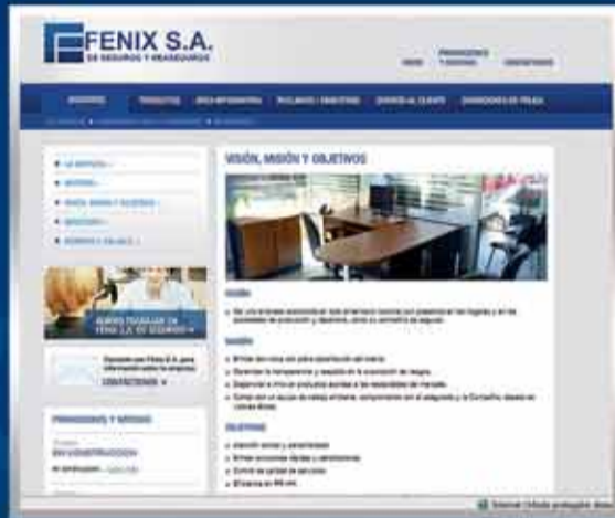
• Quienes somos