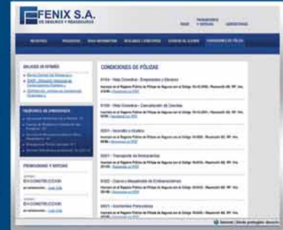
• Condiciones de Pólizas